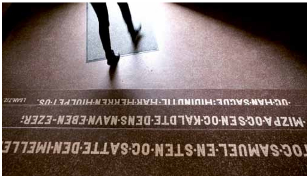
Indgangsparti og trappen ind til missionshuset Eben Ezer, Brammersgade i Århus. Trappen er deltagerens første møde med missionshuset, og indgraveringen i trappen indeholder en bibelsk reference til navnet Eben Ezer.