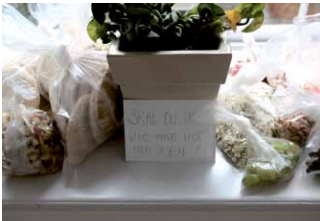
En gang om måneden er der fællesspisning i Eben Ezer inden torsdagsmødet går i gang. Billedet viser den mad, der er tilovers efter fællesspisningen, som deltagerne kan tage med hjem.

for at kristendommen virkeliggøres, og de selv bliver kristne. Som det fremgår af denne informants beskrivelse, der viser samspillet mellem den enkeltes og fællesskabets aktive konstruktion og forståelse af Gud. Hun siger: